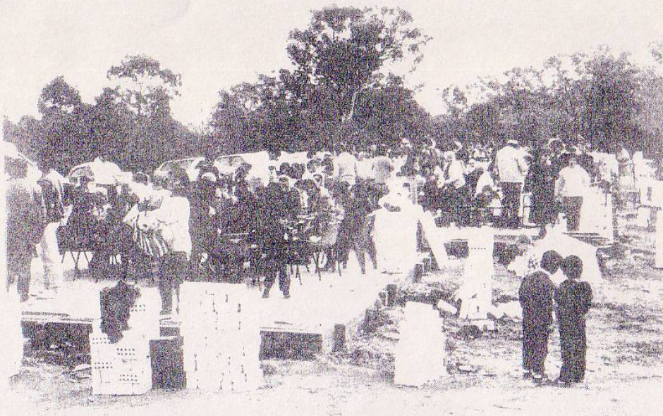
GUESTS ARE USING THE BRICKS AS TABLES A REAL ARMENIAN CELEBRATION