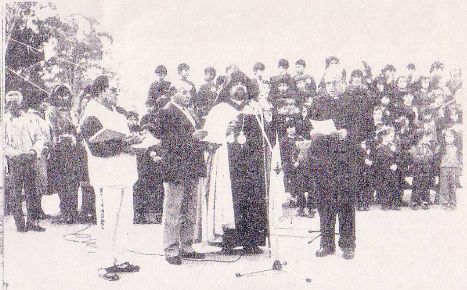
THE CEREMONY OF THE BLESSING OF THE FOUNDATION STONE THE PEOPLE JOINING IN THE PRAYERS